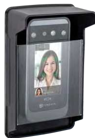
Gabinete para uso externo