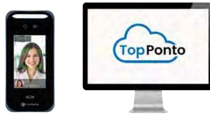
Controle de ponto