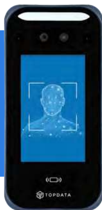
Leitor Facial F4 5 mil usuários

Pode ser usado em ambientes de pouca luz, pois possui câmera infravermelha e iluminação automática