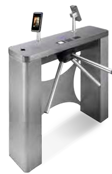
Controle de acesso